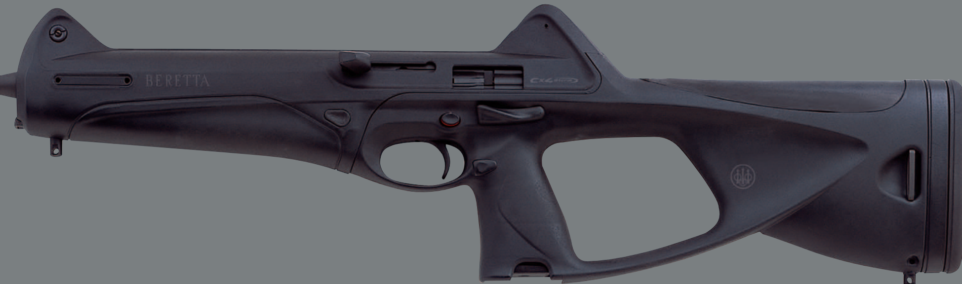
Cx4 Storm (Black)

caduta, un sistema di sicurezza blocca la corsa dell'otturatore mentre un ulteriore dispositivo impedisce lo sganciamento del cane. Sull'espulsore è presente un avviso di colpo in canna. La canna in acciaio Ni, Cr, Mo, lunga 422,5 mm, martellata a freddo (rigatura compresa) e cromata internamente, garantisce un elevato standard di precisione. Il