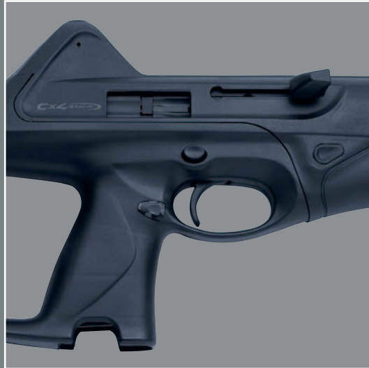
Reversibile per tiratori mancini. Reversible for left-handed users. Réversible pour tireurs gauchers.