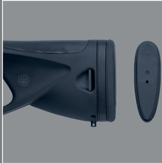
Lunghezza calcio adattabile. Stock length can be adapted. Longueur de crosse adaptable.