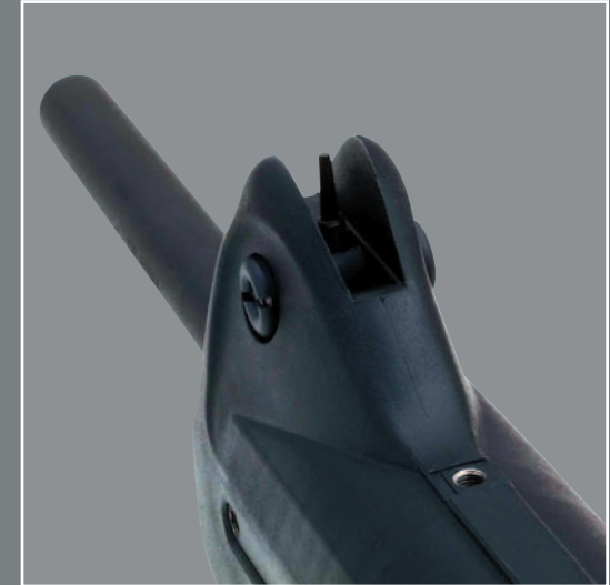
Mirino regolabile e abbattibile. Adjustable folding front sight. Guidon réglable et adaptable.