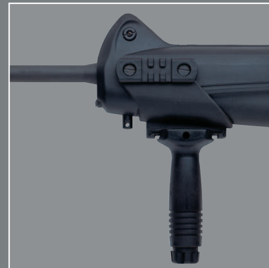
Slitte Picatinny laterali, inferiori e impugnatura anteriore (optional). Side and bottom Picatinny rails, front grip (optional). Supports Picatinny pour accessoires latéraux, inférieurs et poignée antérieure (en option).

moyen d'un bouton, la sûreté automatique est toujours active sur le percuteur et ne se dégage que quand la détente est pressée à fond. En cas de choc violent à cause d'une chute, un système de sûreté bloque la course de l'obturateur alors qu'un autre dispositif empêche le décrochage du chien. Le canon en acier Ni, Cr, Mo de 422,5 mm de long, martelé à froid (rayures comprises) et chromé