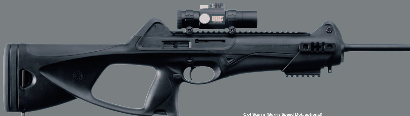
Cx4 Storm (Burris Speed Dot, optional)